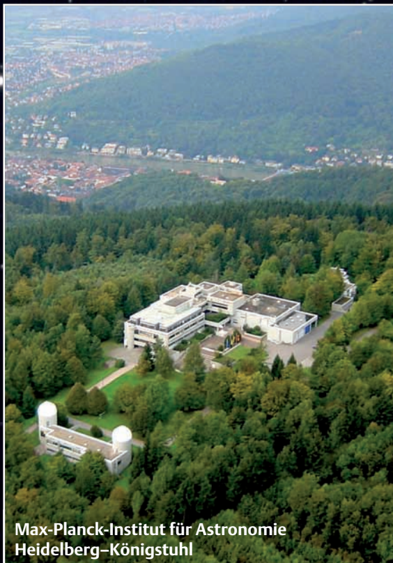
Max-Planck-Institut für Astronomie Heidelberg-Königstuhl

Tag der offenen Tür Sonntag, den 17. Mai 2009 10 – 17 Uhr